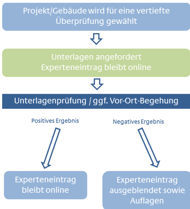
Abb: Ablauf der vertieften Überprüfung

Wurde ein Experte für eine vertiefte Überprüfung ausgewählt, wird er von der Koordinierungsstelle (per Post, E-Mail oder Fax) informiert und zur Einreichung entsprechender Unterlagen aufgefordert.